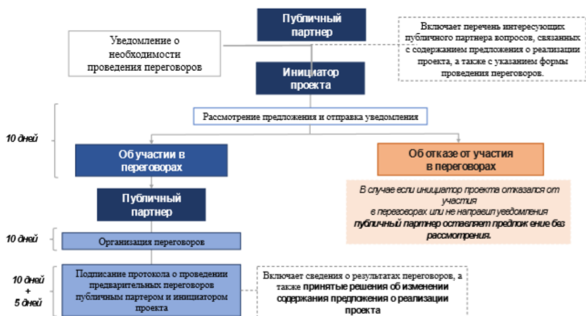
Рисунок 5 – Общая схема проведения переговоров.