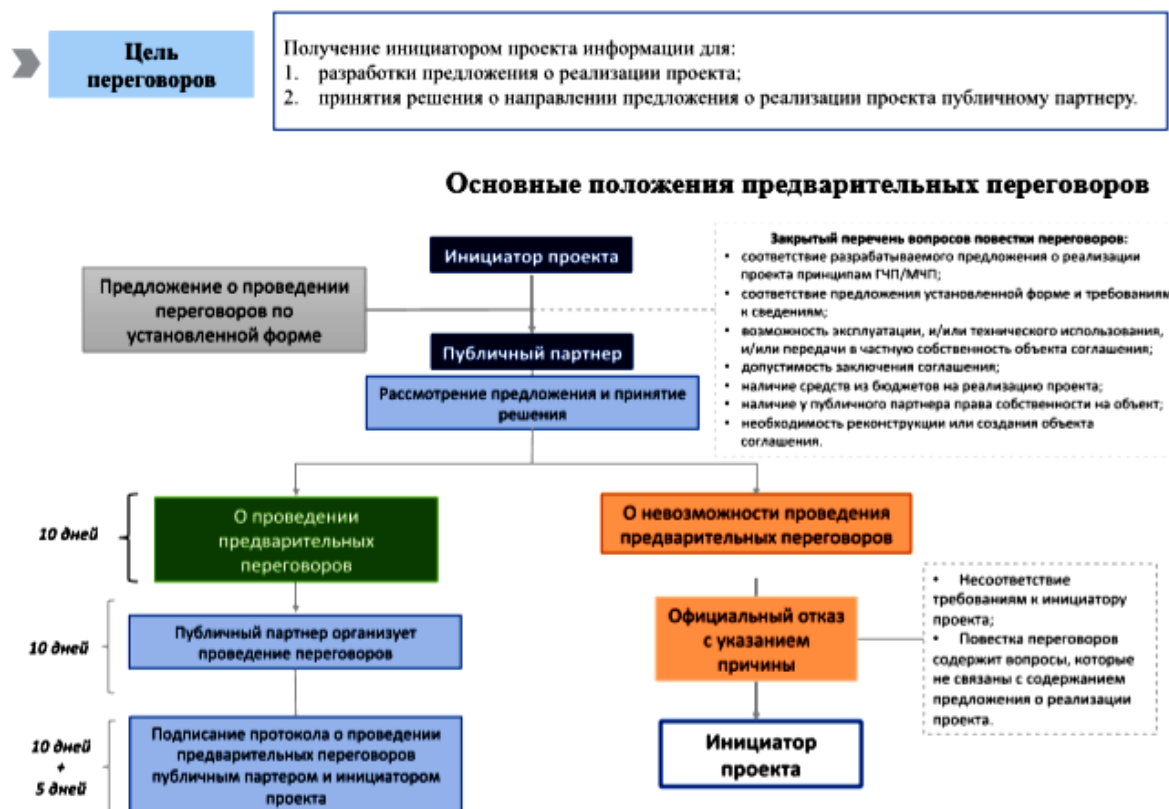
Рисунок 3 – Общая процедура проведения предварительных переговоров.