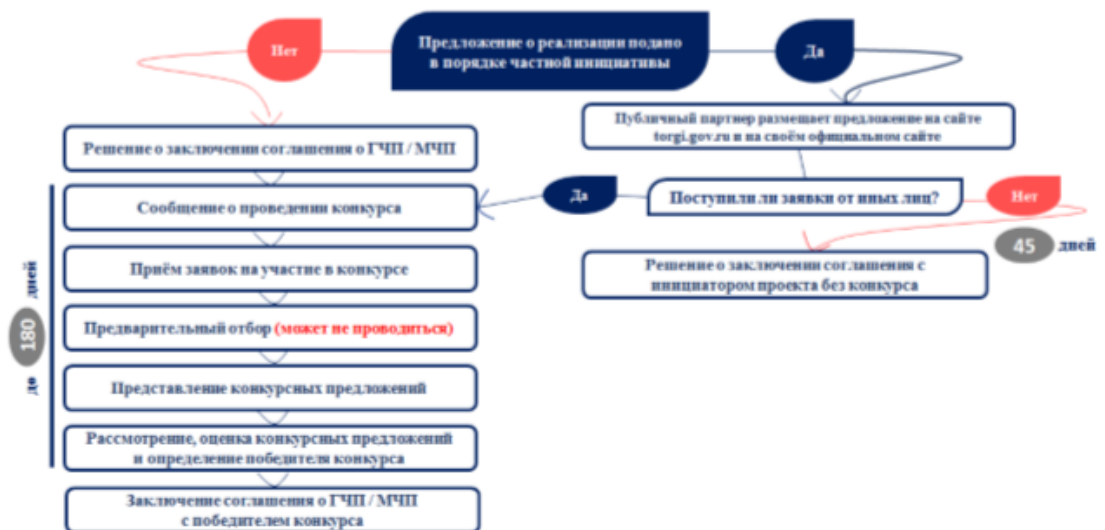
Рисунок 7 – Этапы организации и проведения конкурса на заключение соглашения на создание и реконструкцию детских оздоровительных лагерей.

4) не позднее чем через один день со дня истечения срока для подписания соглашения участником конкурса, конкурсное предложение которого по результатам рассмотрения и оценки конкурсных предложений содержит лучшие условия, следующие после условий, предложенных победителем конкурса, если в течение такого срока соглашение не было подписано этим лицом, либо не позднее чем через один день с момента отказа этого лица от заключения соглашения.