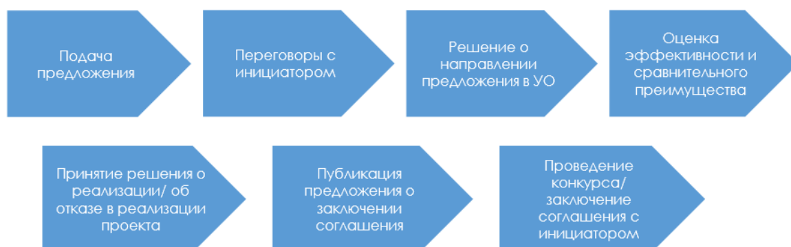
Рисунок 2 – Частная инициатива по Федеральному закону № 224-ФЗ.