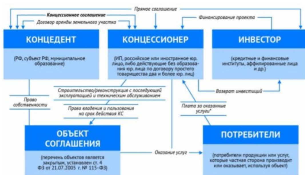
Рисунок 8 - Общая схема реализации концессионного соглашения.

Концессионер – это индивидуальный предприниматель, российское или иностранное юридическое лицо, либо действующие без образования юридического лица по договору простого товарищества (договору о совместной деятельности) два и более указанных юридических лица.