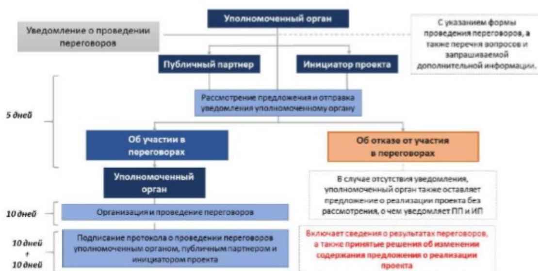
Рисунок 6 – Проведение переговоров с уполномоченным органом.

Переговоры проводятся согласно правилам, утвержденным постановлением Правительства РФ от 03.12.2015 г. № 1309.